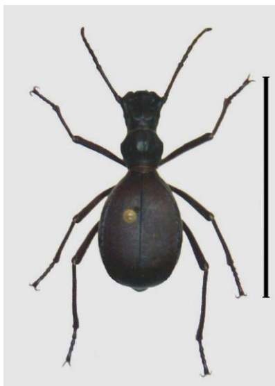
Figura 1. Habitus de Leptoderis collaris (Linnaeus, 1767). Escala 20 mm.